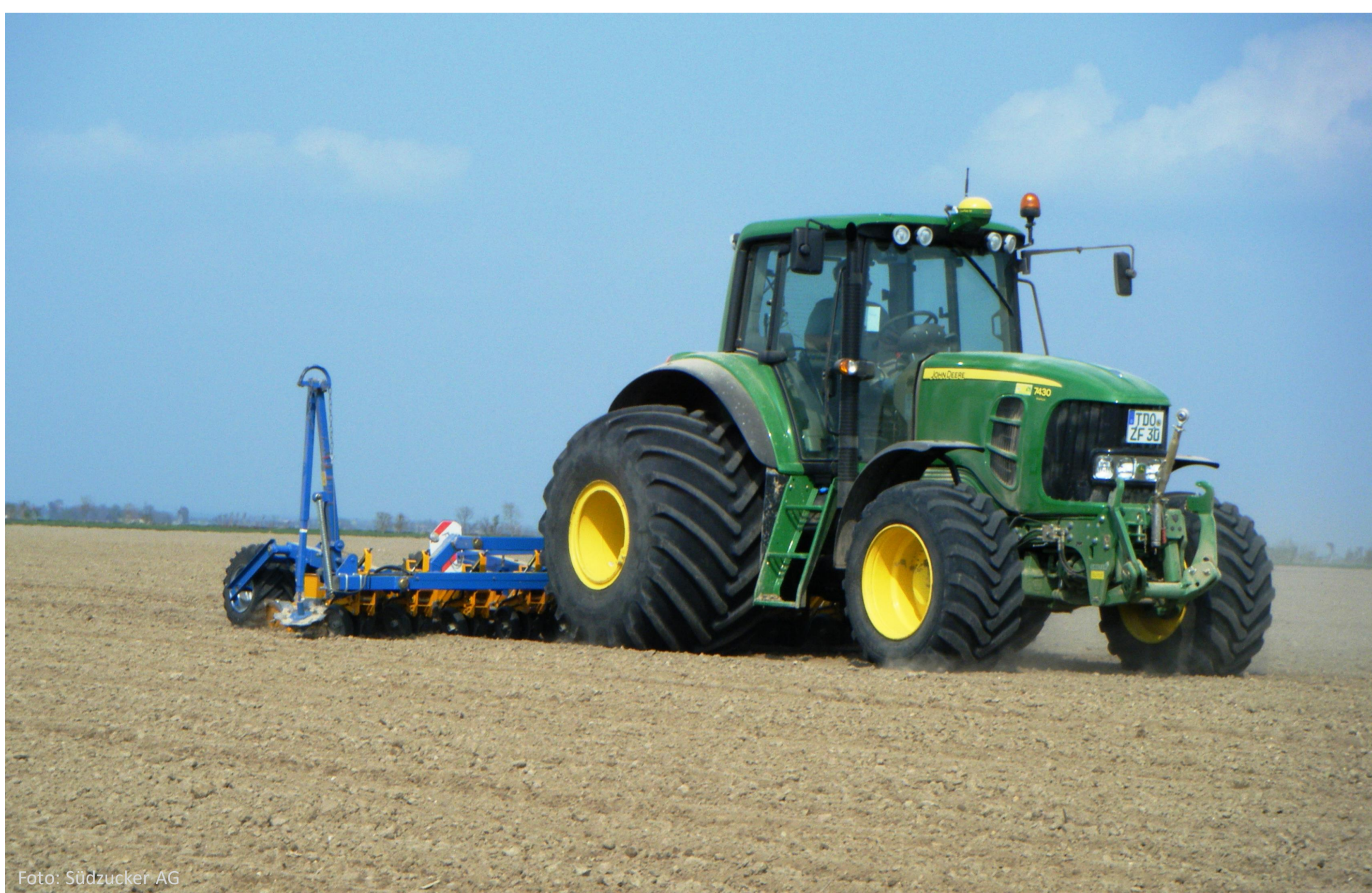
Aussaat mit bodenschonenden Breitreifen