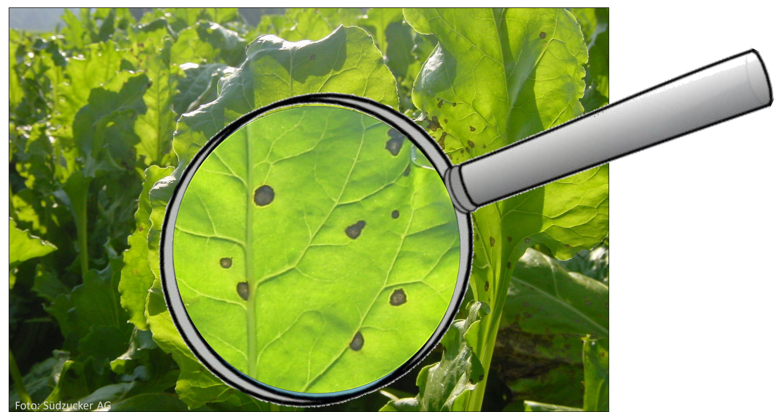
Kontrolle der Blätter auf Befall mit Krankheiten – Behandlung nur wenn nötig

Wenn man Schädlinge, Unkräuter und Krankheitserreger früh erkennt, braucht man für ihre Bekämpfung sehr wenig Pflanzenschutzmittel.