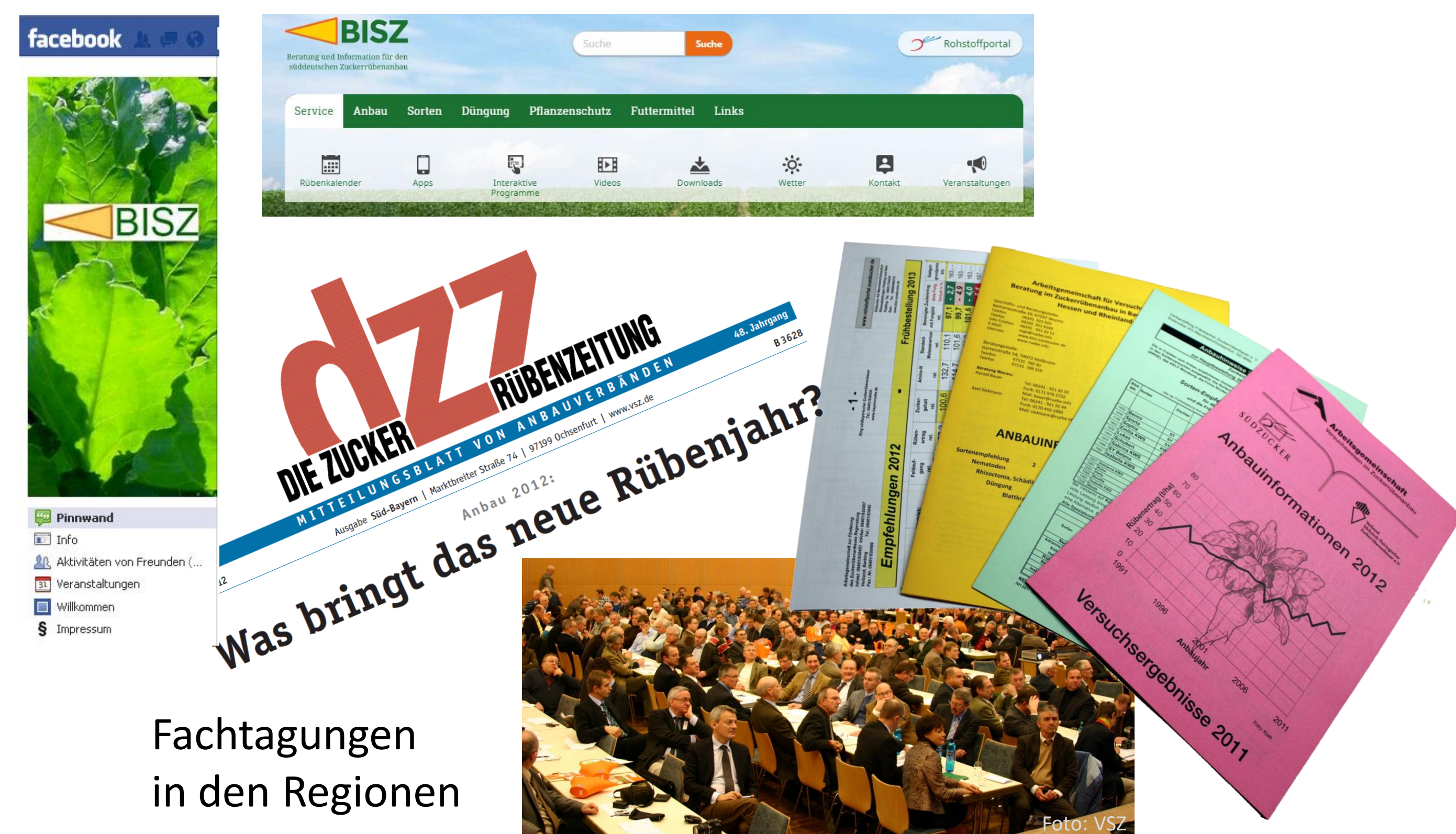
Fachtagungen in den Regionen

Beratung und Information gibt es das ganze Jahr über: in Versammlungen, auf dem Feld, schriftlich, per Telefon und natürlich auf unserer Homepage oder auf Facebook