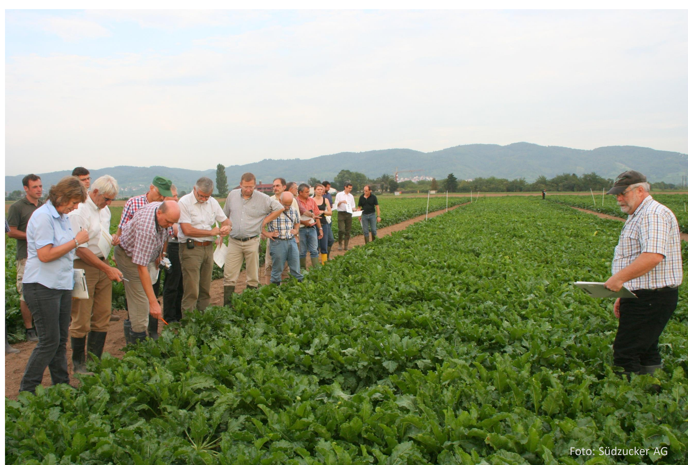
Versuchsbesichtigung: Beratung vor Ort